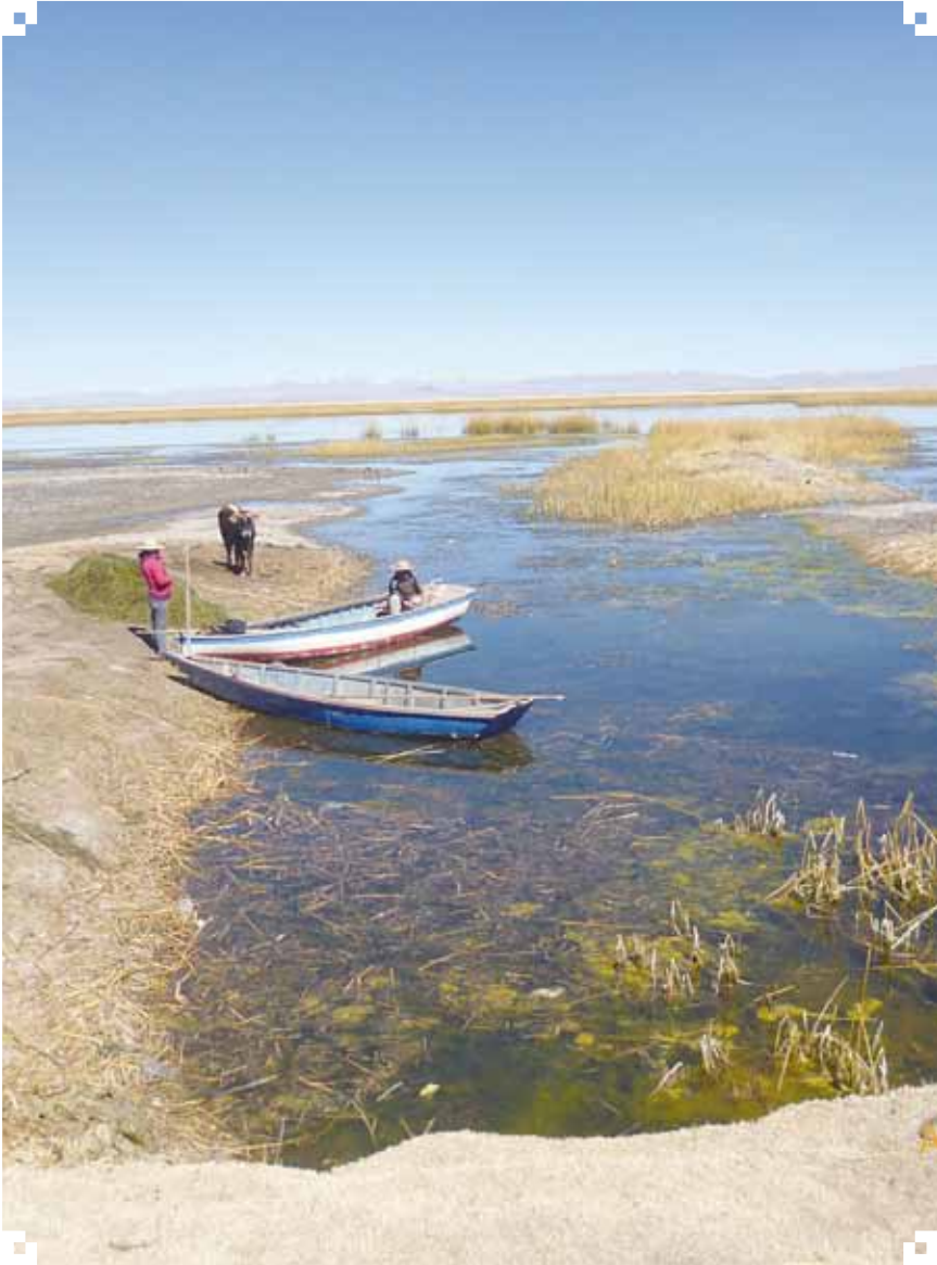
En el río de los Iruhito Urus