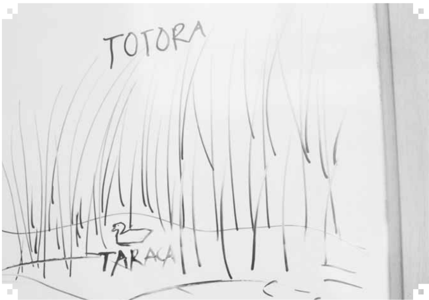
Representación gráfica de la Taraka en Llapallapani

La composición histológica y sanguínea de la taraka es aprovechada al máximo por los uru, la carne se ocupa para preparar succulentos platillos y la sangre fresca y pura se ocupan para la enfermedad del “qharisiri” para revivir a una persona moribunda y raquitica.