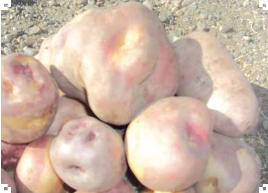
Papa producida en tierras de Vilañeque

Tanto aymaras como urus están a la expectativa sobre los sucesos en las tierras de las orillas del lago, pendientes de cualquier movimiento o pleito social. Las tierras son aptas para la producción de papa, quinua y cebada.