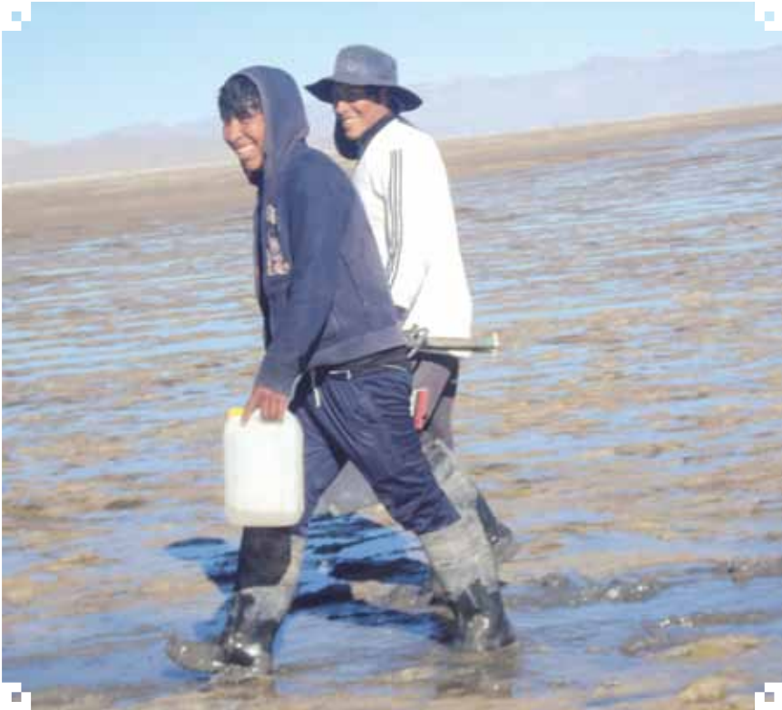
A orillas del Lago Poopó