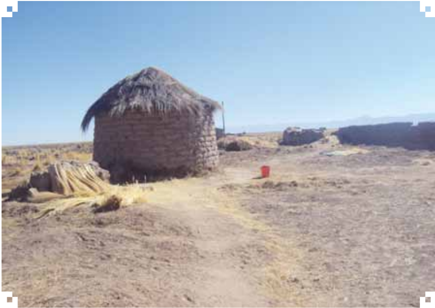
Comunidad Llapallapani, agosto 2013

En la reunión, a través de imágenes en power point socializamos la identidad y los proyectos ejecutados y en ejecución de la FUNPROEIB Andes, asimismo proyectamos la propuesta del perfil de investigación desde la perspectiva institucional. Al final, abrimos el diálogo para las percepciones de los comunarios. Todos los asistentes manifestaron aprobación, pero con tres alertas de dos de ellas y uno de los señores: