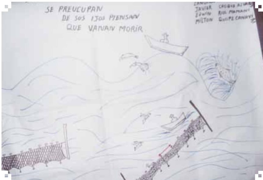
Representación gráfica de la oleada, por niños pescadores de Llapallapani

son parte de su cotidianidad, como algo normal y natural es con lo que siempre van a convivir y es parte de su vida uru, es el mayor desafío dentro el lago.