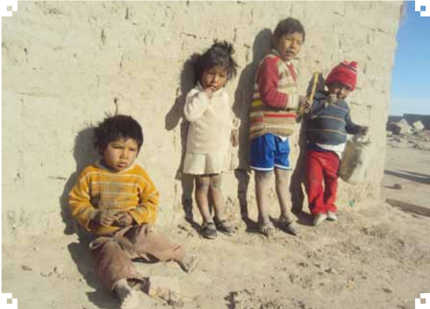
Niños de Vilañeque

Los niños de Vilañeque viven con la enfermedad del resfrío y constantes dolores de estómago “Así siempre es, todos están enfermitos, todos tosen, también vienen con dolores de estómago, es que el agua es salada, no se puede tomar, por eso yo me traigo agua desde Challapata, a veces las señoras también me encargan profe, me lo vas a traer agua de Challapata diciendo, ...pero ellos ya no se dan cuenta, están acostumbrados al agua, ya no sienten (la sal), parece normal ¿a ver probá? Por eso, cada vez están con dolor de estómago, así vienen a pasar clases” (RCH, Vilañeque 21/08/2013).