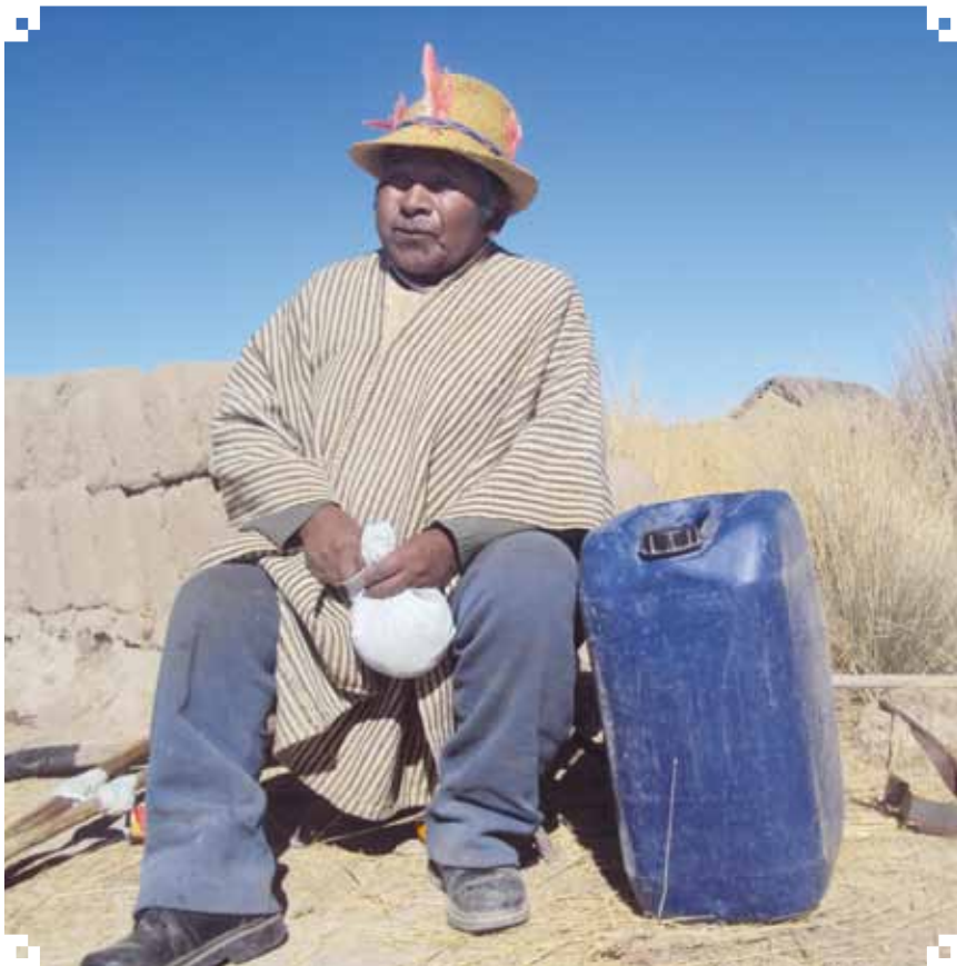
Sabio de Llapallapani