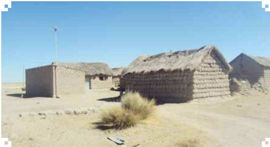
Comunidad Llapallapani, agosto 2013

Empezamos a contactarnos con los profesores de la unidad educativa, ellos nos recibieron con agrado, manifestaron que es una oportunidad para hacer conocer a través de este registro de saberes las condiciones de sobrevivencia de los pobladores de Uru Vilañeque: