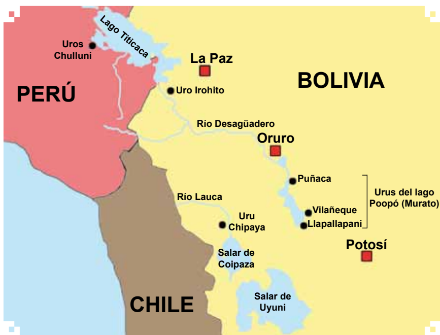
Mapa político de los uru

Los pueblos de Phuñaka, Vilañeque, Llapallapani e Iruhito comparten la práctica de la caza y pesca hasta nuestros días, por lo que el registro de información se hizo en las cuatro comunidades.