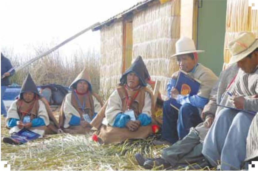
Chulluni, Puno Perú, octubre 2013.

Traducción: Antes vivíamos sobre mat'ara, siempre dentro del lago, recolectando huevos y cazando pariwanas, no buscábamos peces, nuestras casas se llamaban thura.