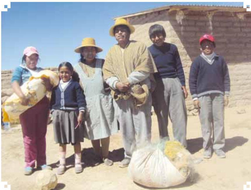
Familia uru de Llapallapani

conversación. Nos contó sobre sus actividades cotidianas, decía que en estos meses (octubre) se dedica a hacer adobes con su esposo porque no hay pescado. La pesca empieza el mes de febrero hasta julio, después es tiempo de desove y crecimiento de peces “... no pescamos así todo el año,... ya no pescamos enero, febrero, hasta marzo, no pescamos desde septiembre,...” Tienen que criar los pescaditos, si no, no puede haber pescado...” (Rubén, Llapallapani, 14/08/2013).