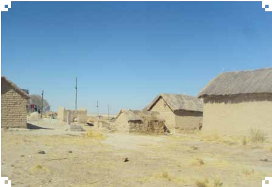
Comunidad Phuñaka, octubre 2013

que pidieron que volvamos. Pero acordamos trabajar en la escuela con algunas entrevistas con los adolescentes, niños y el sabio. El día de la realización, hubo cambio de opinión y postura negativa al registro de datos. Dos maestras tomaron la voz por los estudiantes, mencionando que son celosos de su cultura y no van a querer, además dijeron ¿por qué no han empezado de aquí? ¡siempre empiezan de Llapallapani, esta comunidad es primero, todos van primero a Llapallapani, Machaqa también! ¡al último esta Phuñaka! (DC, Phuñaka 23/08/2013)