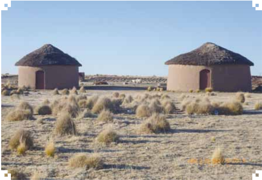
Comunidad Iruhito, septiembre 2013

las principales autoridades, El jiliri Mallku, el Presidente del CENU, el profesor y el secretario de actas de la comunidad. Solicitaron inicialmente informarles sobre los trabajos a realizar en la comunidad y conforme a ello se convocaría a la gente. Así se dieron los hechos, fue el Jiliri Mallku junto a sus colaboradores quien se encargó de convocar a los sabios y sabias para brindar información verídica y, además, en presencia de ellos.