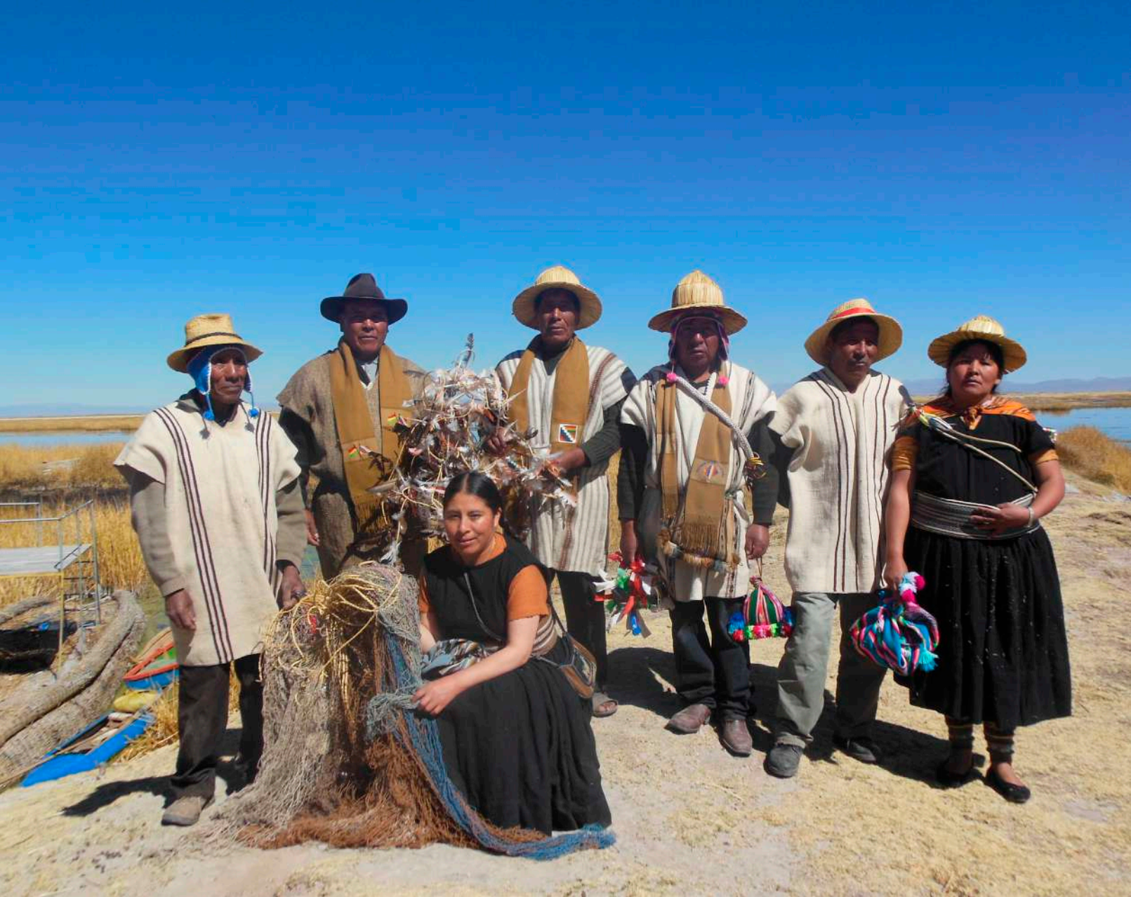
Comunarios de Irohito Urus